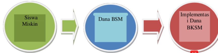
Diagram 2. Alur pemberian BKSM untuk mencegah peserta didik putus sekolah mendapat dana bantuan khusus siswa miskin (BKSM) dan bisa melanjutkan sekolah kembali.

Pemanfaatan dana BKSM merupakan usaha untuk mencegah siswa rawan putus sekolah.